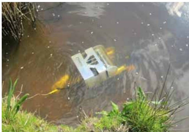
AFBEELDING 1: OPEN ROV, HOGESCHOOL VAN HALL LARENSTEIN (2016).

In 1950 ging Jacques Cousteau (1910-1997) aan de slag op de Calypso. Dit schip was decennialang het decor voor het onderzoek van de ontdekkingsreiziger. Vanaf de Calypso zijn prestigieuze innovaties en ontwikkelingen in gang gezet in het onderzoek naar de onderwaterwereld. Een voorbeeld is de toepassing van Remote Operating Vehicles (ROV's), een soort onderwaterdrone. Innovatieve methoden om met onderwaterdrones (afb. 1) onder water te kijken en te meten zijn nog altijd volop in ontwikkeling. Niet alleen de beelden maar ook sensoren hebben grote meerwaarde om in het big data -tijdperk 3D-informatie te verkrijgen van het watersysteem. Hiermee kan de bewustwording van gebruikers en beheerders worden vergroot. De informatie kan ook gebruikt worden om het waterbeheer nauwkeuriger uit te voeren.